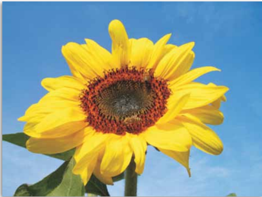
A NAPRAFORGÓ GYÖKERE AZ EGYIK LEGJOBB GYÓGYMÓDJA A CUKORBETEGSÉGNEK

Annak idején egy internetes fórumra egy nyílt levélben leírtam a problémámat. Egy szakorvos megadta a kezdeti lökést, a legtöbb orvost meghazudtolva azt tanácsolta, hogy egy kondicionáló tréning