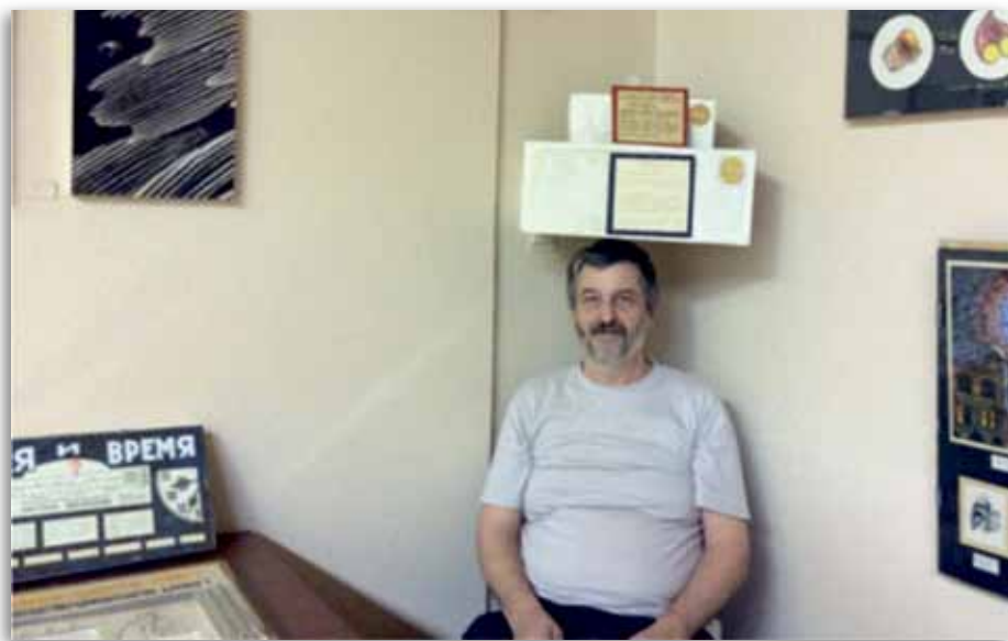
A Grebennikov féle, méh-lépből készült fájdalom elűző dobozok alatt ülök a múzeumban. Kissé pocakosnak tűnök, de csak nem férttem el a dobozok alatt.

Grebennikov figyelte arra, hogy az idő nyugalmi állapotban, például egy szobában sem folyik egyenletes sebességgel. A nagyvilágot persze elsősorban az antigravitáció érdekli. Grebennikov írt egy könyvet „Moj mir” (Az én világom) címmel. Ebben a könyvben az ötödik fejezet foglalkozik a repüléssel. Az interneten megtalálható egy angolból magyarra fordított szöveg ( http://tuvok1.atw.hu/antigrav/greb/greb.htm ). Persze az eredeti szöveg a hiteles. Az is fent van a neten, a könyvet magát gyakorlatilag már nem lehet megtalálni. Létezik azonban Novoszibirszkben egy Grebennikov Múzeum. Az interneten bukkantam rá. Ez egy zárt múzeum, egy szoba az egyik kutatóintézet sokemeletes épületében. A hivatalos neve „Grebennikov Agroökológiai Múzeum”. Az épület falán nincs kiírva semmi, az épületnek házzsáma sincsen. A járókelők nem is hallottak róla. Csak telefonos bejelentkezés alapján lehet bejutni. A múzeum őrangyala egy orosz tudós, a biológiai tudományok kandidátusa, a megboldogult Grebennikov munkatársa. Nagyon kedves lény. A lényeg a lényeg, hogy sikerült bejutnom a múzeumba. 40 percet voltam ott egy másfél órás forgalmi dugó leküzdése után. Nem akartam lekésni a hazafelé induló repülőgé-