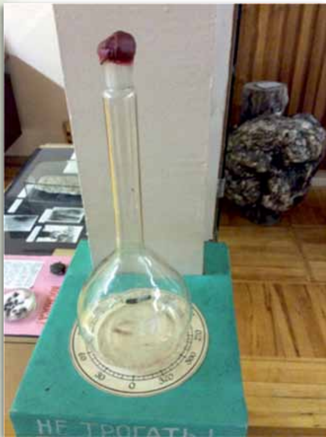
Az eredeti Grebennikov féle anyaghullám regisztrátor. Kipróbáltam. Működik.