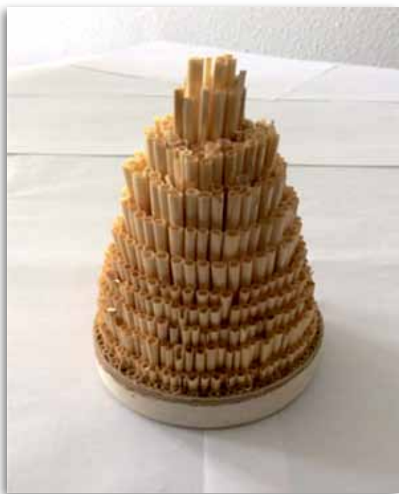
István szalmakúpja. Klasszikus üreges szerkezet.

pet, ezért sajnos csak ennyire futotta. Ez a negyven perc utólag egy percnél tűnt. A gravitoplán persze nem volt kiállítva, Grebennyikovot 1990-es repülései után kezelésbe vette a titkos-szolgálat. Náluk kell keresni, egy másik múzeumban. Grebennyikov másik nagy felfedezése az „Üreges Szerkezet Hatás”, angol rövidítése CSE. A löszfalban, a talaj alatt élő vadméhek fészkei felett éjszakázva érzett először furcsa hatásokat. Fémes ízt a szájában, hol hideget, hol meleget. Káprázott a szeme. Olvastam, hogy egy búzakéve is előidézi ezt a hatást. Magyar népi gyógyásztól tudom, hogy a vályogtégelákból (szalma és agyag keveréke) épült ház leárnyékolja a káros földsugárzásokat. A szalmaszákon is egészen más az alvás. „Később kiderült, hogy a CSE zóna gátolja a szaprofita talajbaktériumok, az élesztőgombák vagy más kultúra növekedését, mint ahogyan a búzacserjén is... A levélvágó méh lárva elkezd foszforeszkálni, miközben a felnőtt méhek még aktívabbakká váltak és két héttel korábban be tudták fejezni a beporzást. Kiderült, hogy a CSE-t (mint ahogy a gravitációt sem) nem lehet leárnyékolni, az hat az élő organizmusokra, áthalad a falon, vastagfémeken, és egyéb árnyékoláson is. Kiderült, hogy ha egy po-